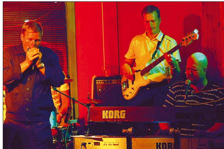
HALVHJERTET: Selv om andre halvdel av konserten på Resepten var bra, veier det akkurat ikke opp for den kjedelige åpningen fredag kveld.

band har nok mange spillejobber foran seg, og som mange an-